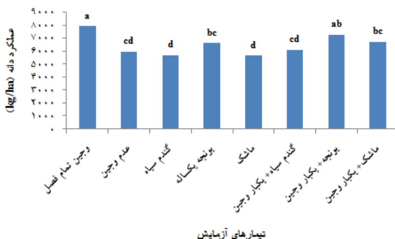
شکل ۳. اثر اعمال کنترل علف‌های هرز بر عملکرد دانه آفتابگردان